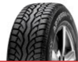
APTERRA WINTER SUV (H)