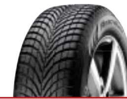
ALNAC 4G WINTER Car (T/H)