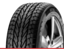
ALNAC WINTER Car (H/V)