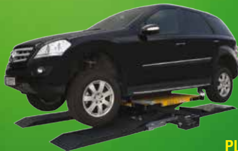
PL 270 N Kiváló minőségű cseh gyártmányú pneumatikus működtetésű gumis emelőgép