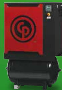
CHICAGO PNEUMATIC prémium kategóriás csavar és dugattyús kompresszorok