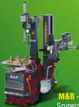
M&B - TC 528 Szuperautomata kétszemélyes kerékszerelő gép