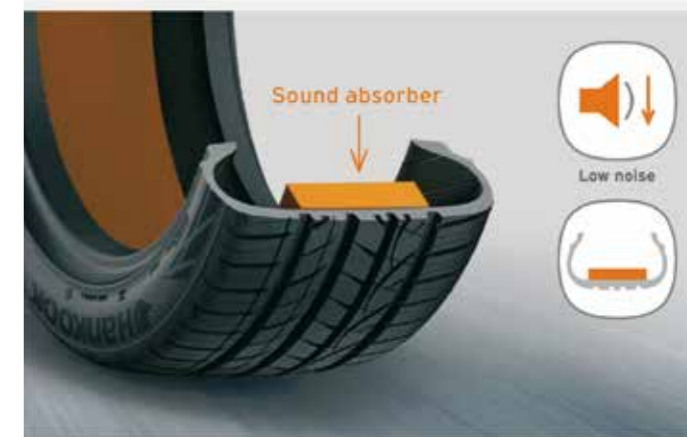
Sound absorber tire

Az alkalmazott akusztikai habot eddig a vállalat saját Sealguard anyagából készültvékony réteg munkaigényes felhordásával rögzítették az abroncs belsejében. A „sound absorber” technológia